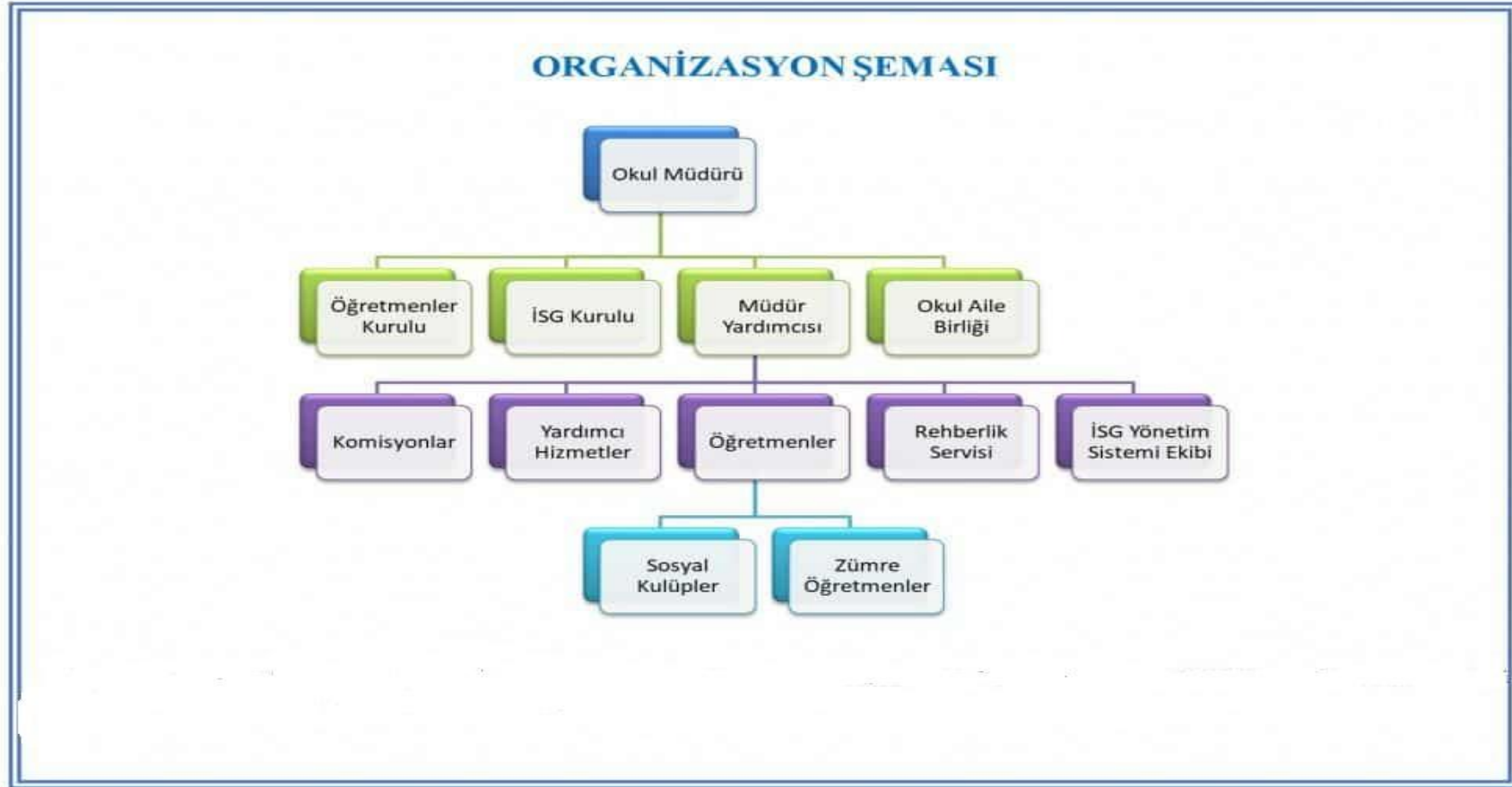
Şekil 1: Organizasyon Şeması